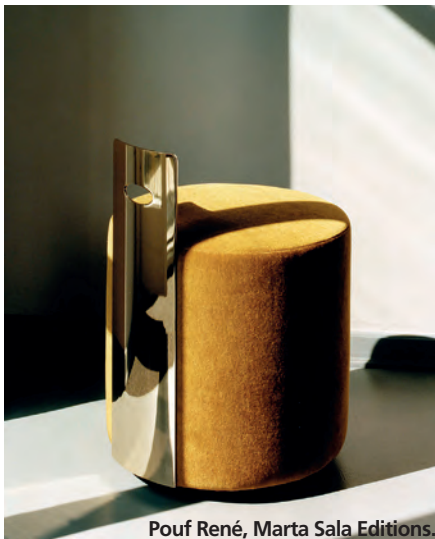
Pouf René, Marta Sala Editions.