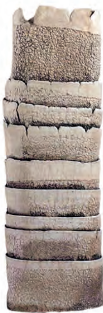
Sculptures de Nevine Bouez.