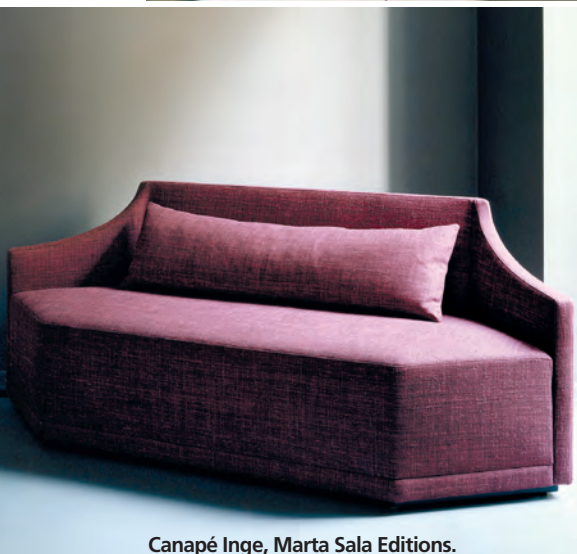
Canapé Inge, Marta Sala Editions.