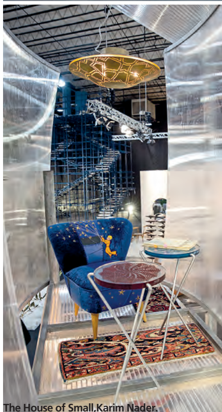
The House of Small, Karim Nader.