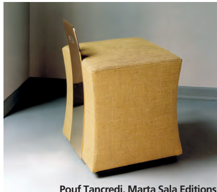
Pouf Tancredi, Marta Sala Editions.