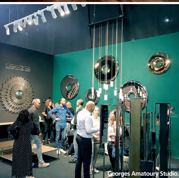
Georges Amatory Studio.