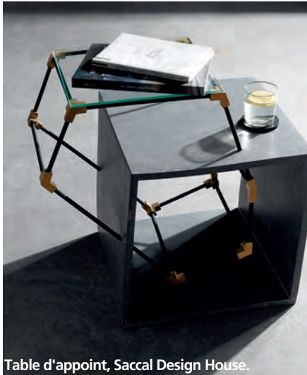
Table d'appoint, Saccal Design House.