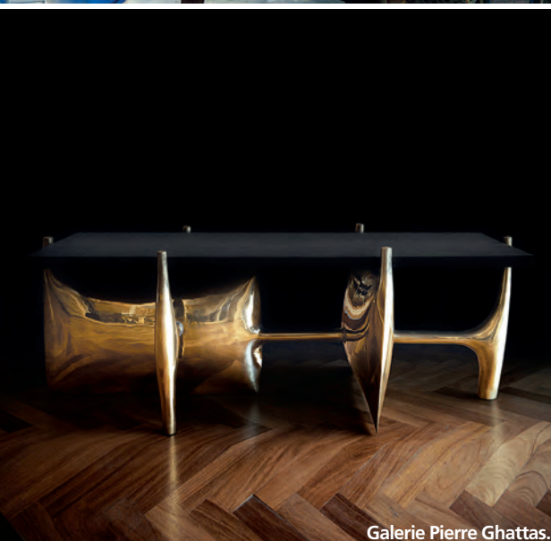
Galerie Pierre Ghattas.